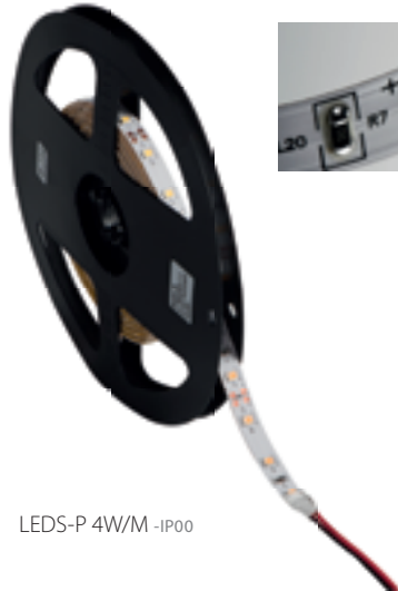
LEDS-P 4W/M -IP00